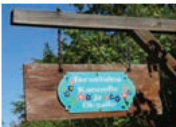
Dobrodošlica na finski način

ljubavi, samosažaljenju, čežnji, ljubavnoj tuzi i bolu stvarajući neistinitu sliku o jednoj luckastoj naciji koja pleše po putevima i šumama.